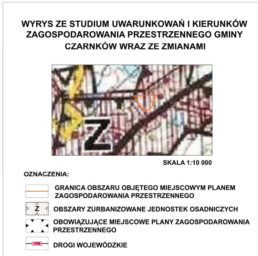
Ryc. 1 Obszar objęty planem na tle wyrysu ze Studium uwarunkowań i kierunków zagospodarowania przestrzennego gminy Czarnków ze zmianami

Opracowanie własne na podstawie materiałów z Urzędu Gminy Czarnków