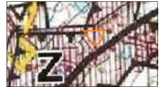
SKALA 1:10 000