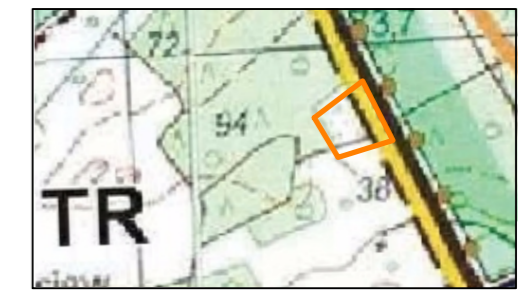
SKALA 1:20 000